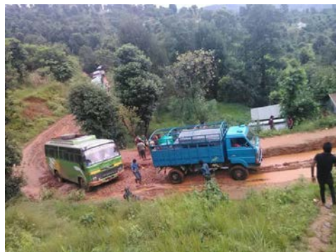
Difficultés de transport de l'ingénieur et des matériaux, suite à la mousson