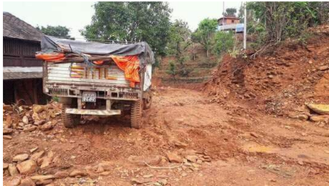
Déchargement de matériel.... Après de long cheminement sur des routes peu carrossables