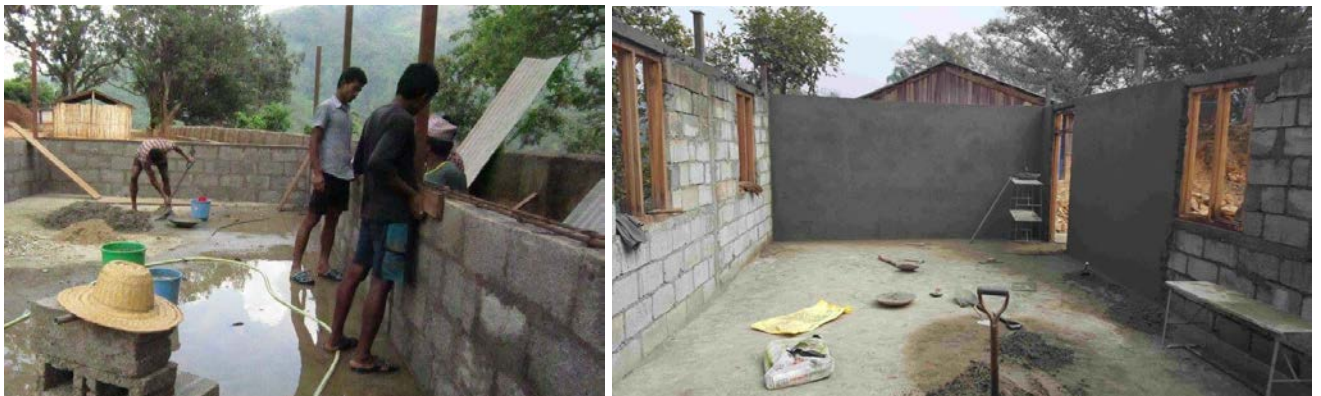
Erection des murs