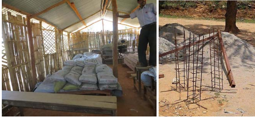
Stockage des matériaux