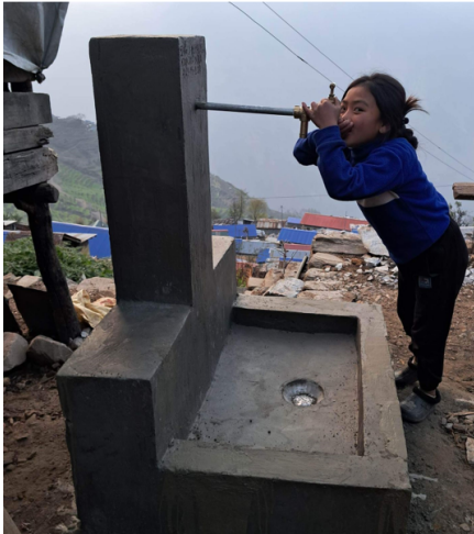
Une des fontaines de Kerauja