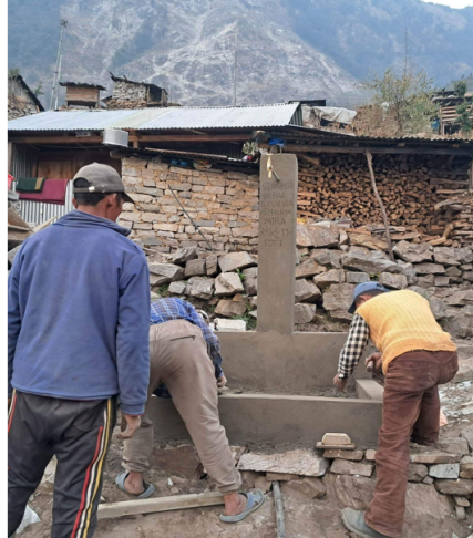
Travaux à Kerauja